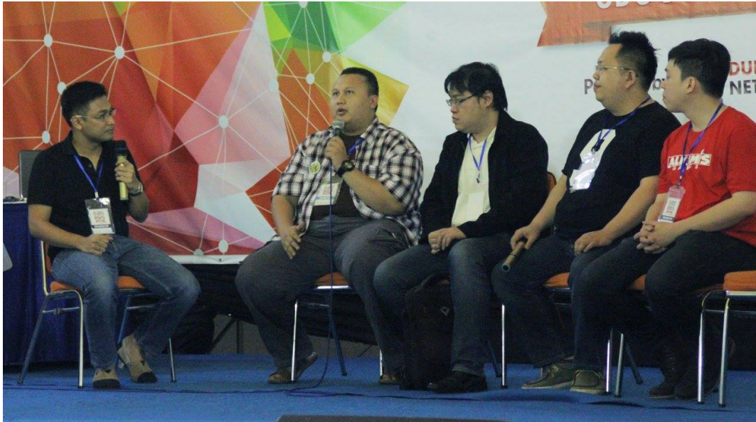
Gambar 2.5 – Gambreng Games di Event Game Developers Gathering Prime 2015