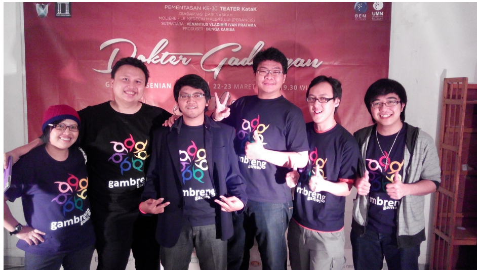
Gambar 2.2 – Founder Gambreng Games