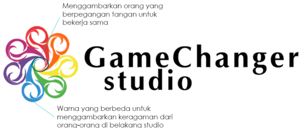
Gambar 2.1 – Logo Gamechanger Studio

Dalam situs resmi PT Gudang Gim Global atau Gamechanger Studio, yaitu http://gamechangerstudio.net/official/ diketahui bahwa studio ini adalah studio gim yang awalnya didirikan oleh dua orang akademisi, dengan cukup banyak pengalaman dalam bidang desain gim (30 gim sejak 2013, platform PC dan mobile ). Kantor pusat studio ini resmi didirikan tanggal 24 Juni 2015, berlokasi di Jalan Jabal Mina IV Rumah Padi blok 04 No. 2-3 Kelapa Dua, Karawaci, Tangerang Selatan, Banten. Beberapa gim buatan studio ini yang terkenal adalah ‘Not a Simulator For Working / NSFW’ dan ‘My Lovely Daughter’.