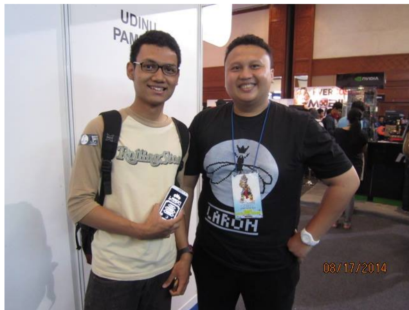
Gambar 2.4 – Showcase Gim ‘Laron’ di Event Indonesia Game Show 2014

Hingga awal tahun 2015, Gambreng Studio juga merilis beberapa game lain di berbagai macam platform. Beberapa diantaranya mendapatkan penghargaan dalam ajang kompetisi 'CompFest 2014'.