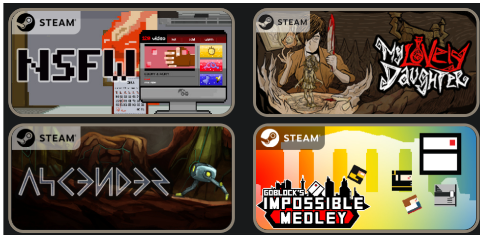
Gambar 2.7 – Gim - Gim Gamechanger Studio yang Dipublikasikan melalui Steam

Di tahun 2018, mereka merilis ‘My Lovely Daughter’, yang menuai kesuksesan yang baik dan sempat menjadi viral di China. Saat ini, Gamechanger Studio sedang mengembangkan sekuel dari My Lovely Daughter, yaitu My Lovely Wife, yang mana penulis berkesempatan untuk memberikan kontribusi kedalamnya.