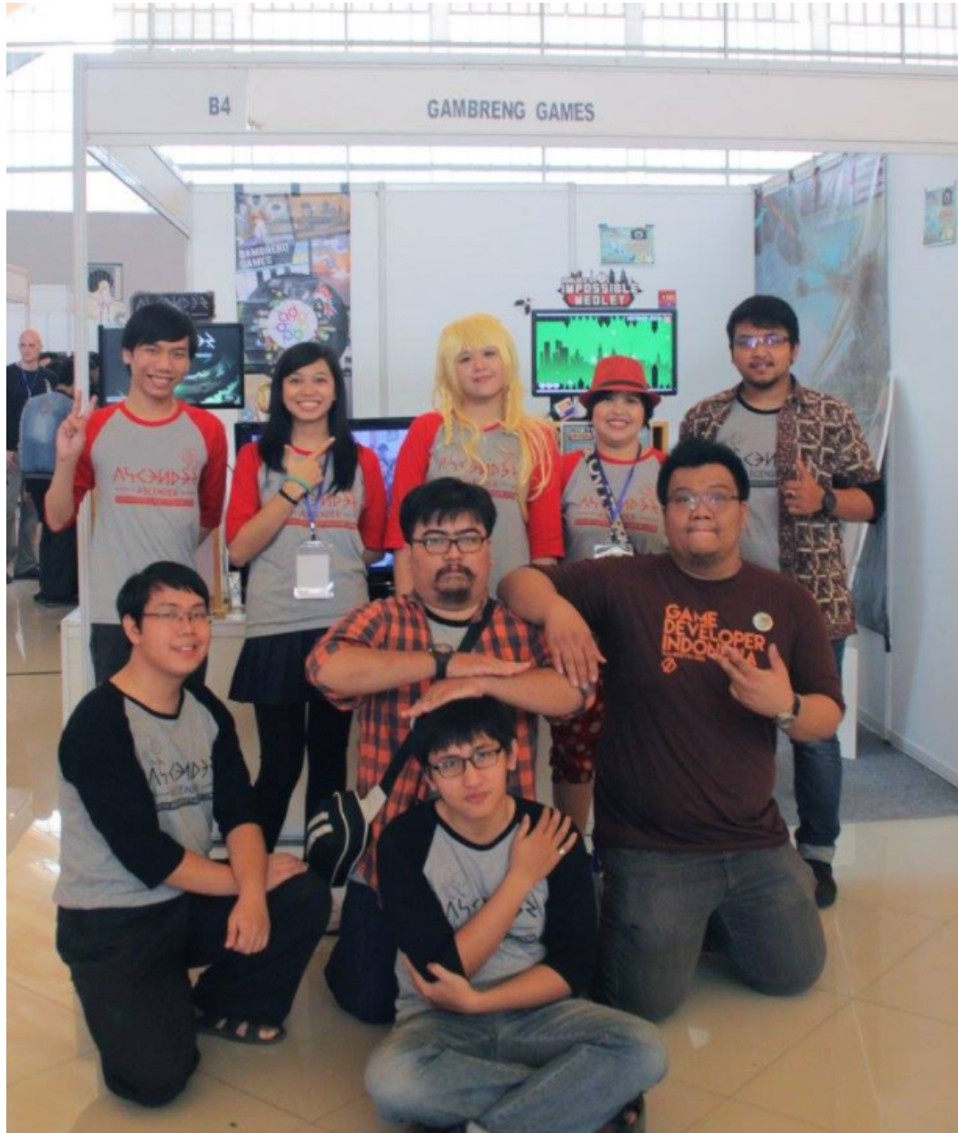
Gambar 2.6 – Gambreng Games di Event Game Developers Gathering Prime 2015

Di tahun 2016, Gambreng Studio mulai merambah platform baru yaitu PC. Mereka kemudian membuat sebuah brand untuk membedakan platform PC dengan platform mobile , yang kemudian dinamakan ‘Gamechanger Studio’, dan bersamaan dengan itu mereka merilis game pertama di platform ini yang diberi