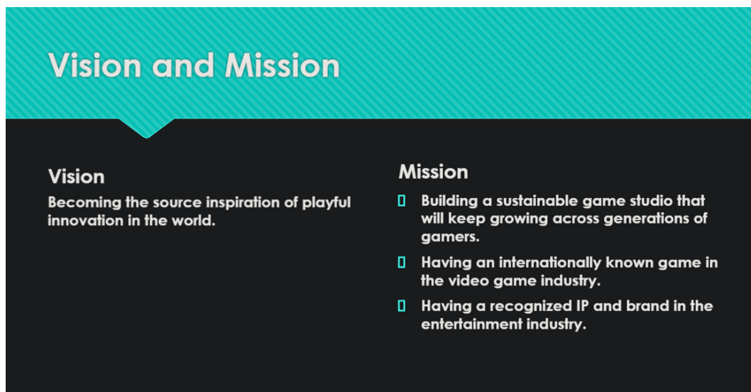
Gambar 2.8 – Visi dan Misi Perusahaan