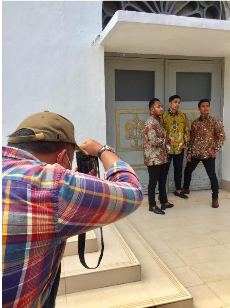
Gambar 2.9.7. Proses photoshoot promosi edisi Ramadhan dan Idul Fitri