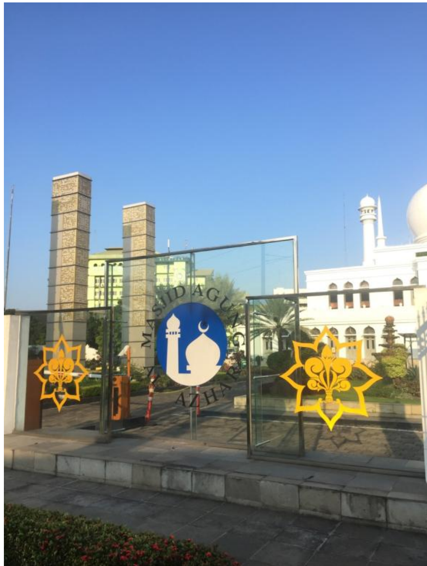
Gambar 2.9.6. Survei lokasi photoshoot promosi edisi Ramadhan

Fitri. Pada minggu ke-13 (19-22 April 2021), merupakan minggu terakhir penulis dalam masa 3 bulan praktik kerja magang. Dari hal tersebut, penulis mendesain promosi free tailoring spesial Ramadhan, mengedit video promosi spesial Ramadhan dan membuat motion graphic ads spesial Ramadhan.