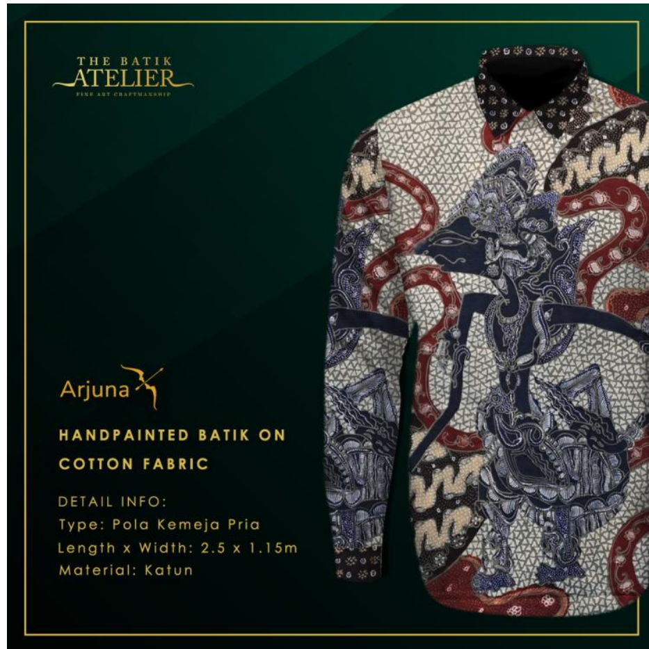
Gambar 2.9.1. Mock-up kain batik

Kemudian, penulis membantu desainer grafis lainnya untuk membuat katalog promosi. Pada minggu ke-5 (22-26 Februari 2021), penulis melakukan mock-up kain batik untuk diunggah menuju media sosial dan katalog. katalog tersebut berukuran dengan standar a4 (29,7 cm x 21 cm) dan standar rasio media sosial The Batik Atelier gunakan adalah 4:6 atau setara dengan ukuran 1080 pixels x 1350 pixels . Penulis ditugaskan oleh pembimbing lapangan untuk merancang kembali company profile .