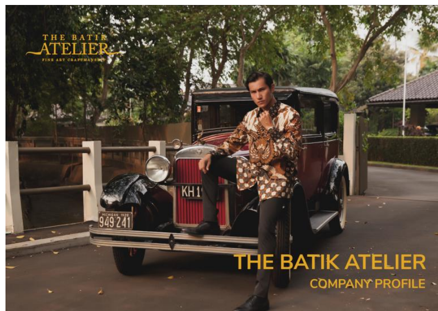
Gambar 2.9.2. Cover re-design company profile The Batik Atelier.

Pada minggu ke-6 (1-5 Maret 2021), penulis melanjutkan desain company profile dan melakukan asistensi kepada pembimbing lapangan terkait progress dari perancangan tersebut. Pada minggu tersebut juga bahwa penulis membuat video motion graphic website perusahaan untuk memperkuat ketertarikan konsumen dalam membeli batik tulis. Kemudian, penulis bersama divisi penulis melakukan diskusi guna untuk menyusun strategi media periode bulan Maret hingga April.