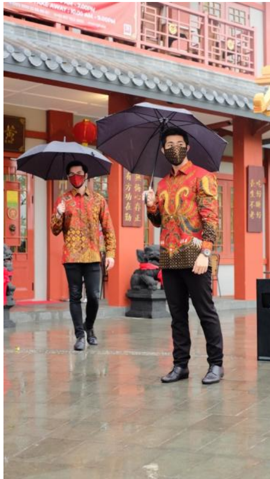
Gambar 2.5. Proses photoshoot promosi edisi Chinese New Year

mempromosikan motif-motif batik terbaru yang akan dipublikasikan kepada konsumen The Batik Atelier. Penulis melakukan proses editing video promosi yang akan diunggah menuju media sosial The Batik Atelier.