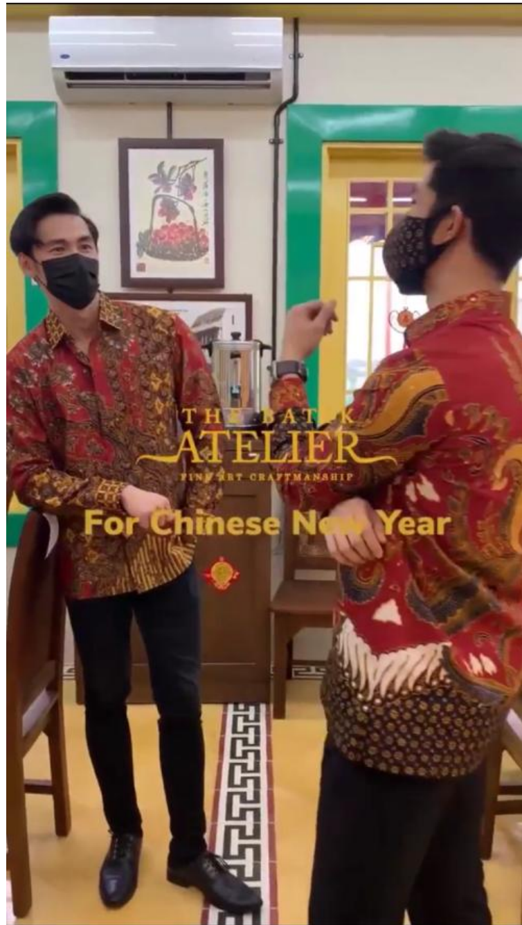
Gambar 2.8. Tangkapan layar behind the scene promosi edisi Chinese New Year .