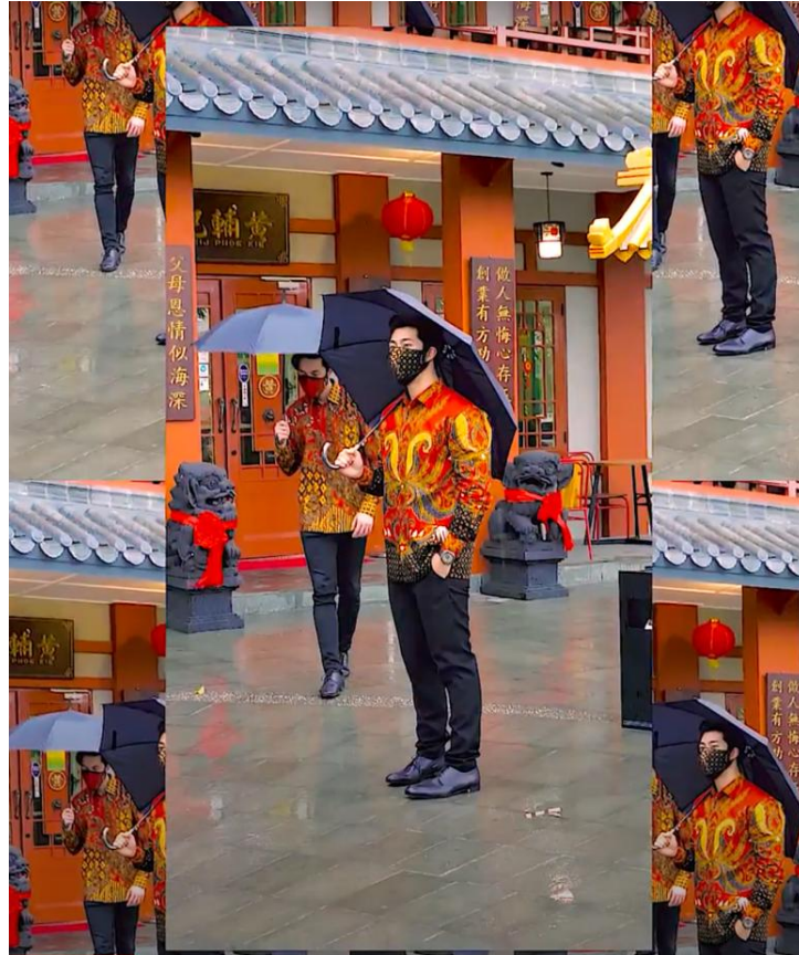
Gambar 2.6. Tangkapan layar video photoshoot promosi edisi Chinese New Year