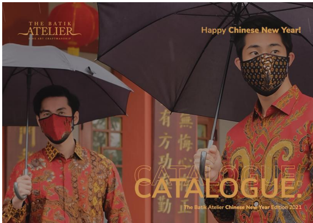
Gambar 2.7. Cover perancangan katalog batik edisi Chinese New Year .

foto dan video promosi dengan berbasis motion graphic edisi Chinese New Year . Setelah proses tersebut berjalan dan selesai, penulis memberi hasil desain kepada pembimbing lapangan untuk diunggah ke media sosial The Batik Atelier.