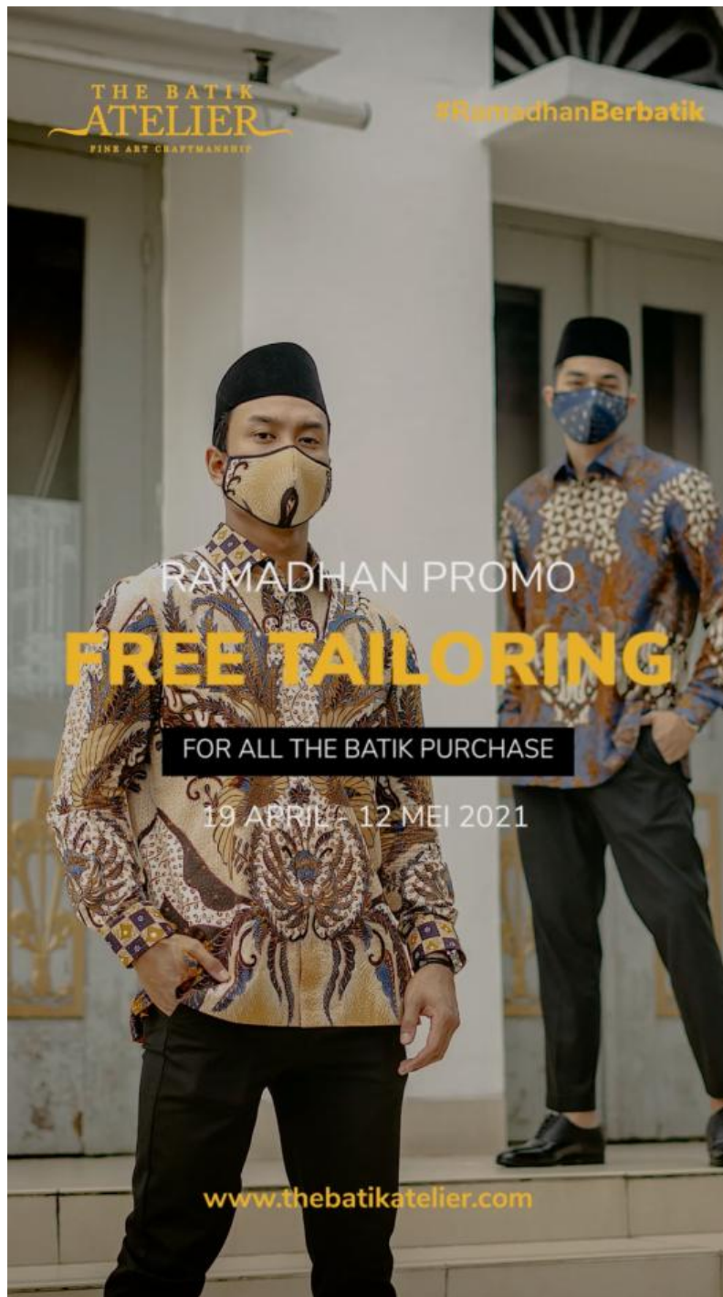
Gambar 2.9.9. Tangkapan layar video promosi free tailoring spesial Ramadhan