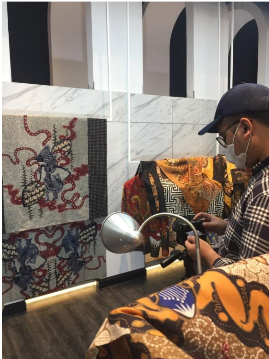
Gambar 2.9. Proses photoshoot kain batik

Pada minggu ke-4 (15-19 Februari 2021), penulis mendapat tugas dari pembimbing lapangan untuk melakukan foto seluruh kain batik yang baru saja dikirim dari pengrajin dan pembimbing lapangan memberikan arahan berupa prosedur dalam melakukan foto dan mock-up/implementation kain batik.