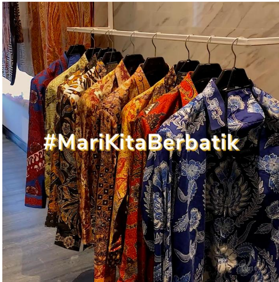
Gambar 2.9.3. Tangkapan layar video campaign 1 tahun galeri The Batik Atelier