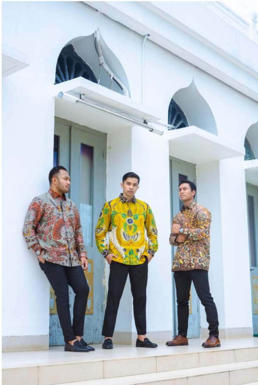
Gambar 2.9.8. Hasil photoshoot promosi edisi Ramadhan dan Idul Fitri