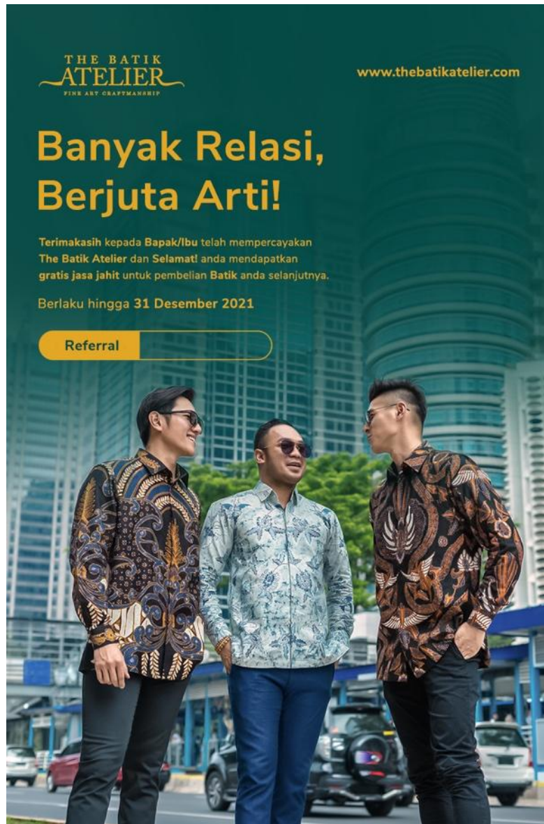
Gambar 2.9.5. Referral voucher design The Batik Atelier