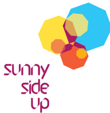
Gambar 2. 1. Logo Perusahaan Sunny Side Up ( https://www.facebook.com/SunnySideUpPost/ )

Sunny Side Up merupakan studio post-production yang terlibat dalam Television Commercial (TVC), dan memiliki peran dalam produksi sebuah iklan. Peran tersebut dapat berupa rotoscoping , motion graphics , editing , beserta perubahan lanjut dalam konten film seperti color grading . Studio tersebut telah menerima pekerjaan dari beberapa klien: Coca-Cola, Wardah, Danamon, Azura, Telkomsel, Nescafe, Gojek, Emina, Tokopedia, Pizza Hut, dan seterusnya (Iqbal, 2020).