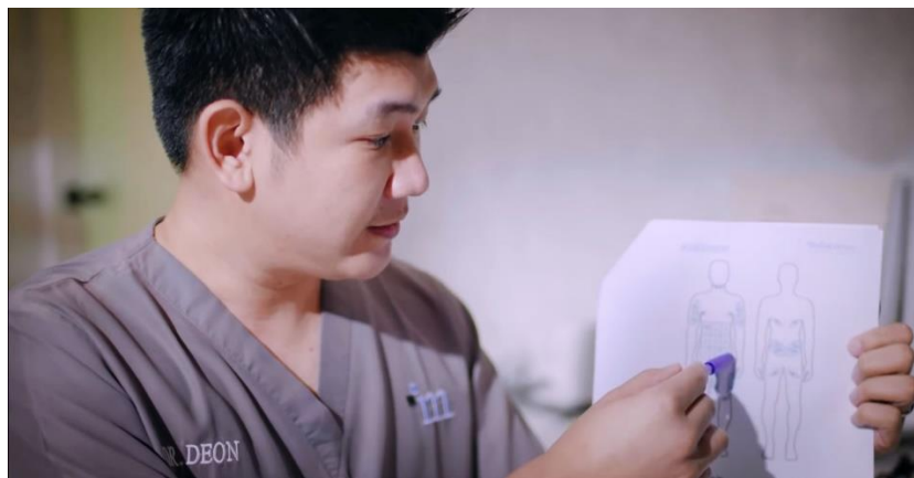
Gambar 2.1.2. Video Profile Maharis Clinic

Hal ini memberikan dampak yang sangat besar kepada public karena di era sekarang, hampir semua orang memiliki media social dan bahkan lebih dari satu. Berikut adalah hasil karya dari tim Maharis Production . Berikut adalah beberapa karya tim Maharis Production yang sudah dikerjakan untuk media social dan juga untuk promosi produk.