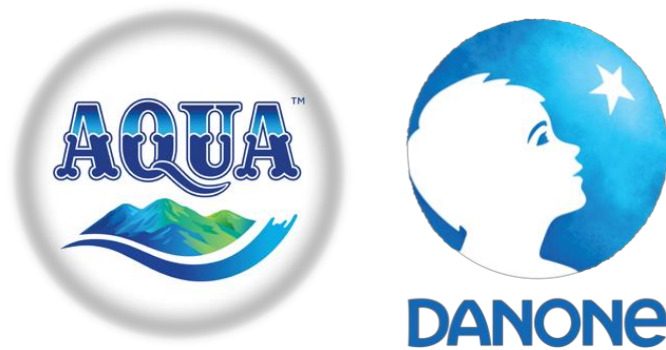
Gambar 2.1. Logo Terbaru Danone-Aqua

Berikut ini merupakan logo terbaru yang digunakan oleh Danone-Aqua: