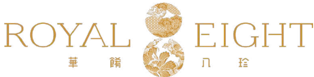
Gambar 2.2. Logo Royal 8 Chinese Restaurant

dekorasi Chinese klasik pada langit-langit dan dinding restoran, selain itu meja makan yang dipakai berupa meja bundar dengan bahan marmer. Royal 8 sangat cocok digunakan untuk berbagai macam acara seperti family dinner , meeting , gathering , product launching , hingga sangjit dan pesta pernikahan.