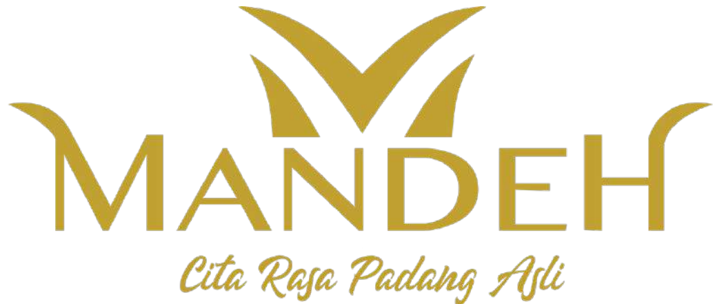
Gambar 2.4. Logo Mandeh Restoran Padang

menyediakan tempat yang luas untuk digunakan sebagai tempat berkumpul dan acara penting lainnya.