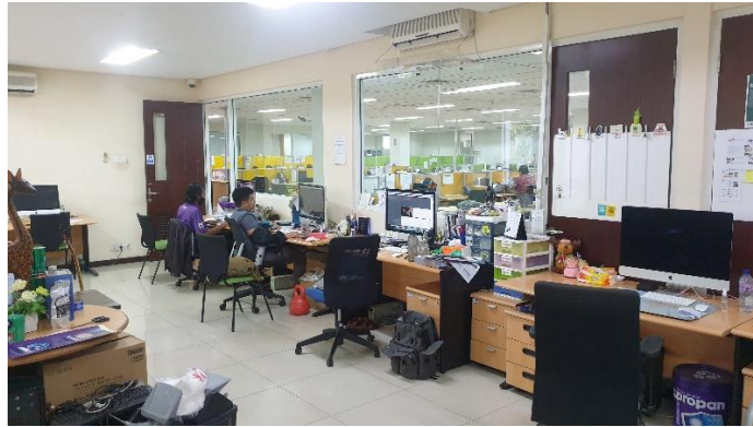
Gambar 2.2. Suasana Kantor PT. Propan Raya ICC

Karyawan-karyawan yang terlibat dalam tim desain grafik terhitung kecil, hanya kurang lebih 9 orang yang meliputi Graphic Designer Unit Head , Graphic Designer , Videographer . Dalam periode tertentu pihak PT. Propan Raya ICC juga mempekerjakan pekerja magang.