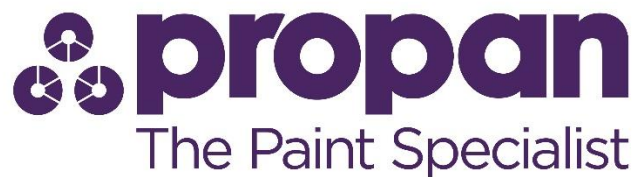
Gambar 2.1. Logo Perusahaan PT. Propan Raya ICC