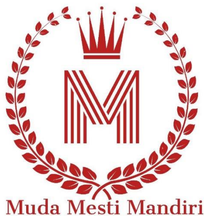
Gambar 2. 1 Logo PT. Muda Mesti Mandiri

Gambar 2.1 PT. Muda Mesti Mandiri merupakan perusahaan yang berdiri sejak tahun 2018 dan berada di daerah Jakarta Utara yaitu Workspace Building Lt.1, Unit C20, Jl. Pluit Indah. Perusahaan ini bergerak dalam bidang import yaitu menjadi produsen barang-barang dari luar negeri dan PT. Muda Mesti Mandiri sudah menjalin kerja sama yang baik dengan perusahaan di luar negeri yaitu Singapore dan akan menjalin kerja sama lagi dengan perusahaan yang ada di negara Thailand dan Jepang untuk kedepannya.