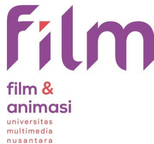
Gambar 2.2. Logo Prodi Film

Warna biru memiliki makna Teknologi, dimana teknologi yang dimaksudkan adalah teknologi informasi dan komunikasi (ICT). (UMN. Tanpa tahun. https://www.umn.ac.id/profil/ ).