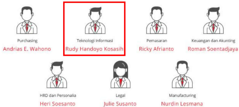
Gambar 2. 3 Bagan Divisi di PT. XYZ

Gambar 2.3 merupakan bagan divisi di PT.XYZ. Dalam kegiatan magang ini, ditempatkan dalam divisi Teknologi Informasi yang dipimpin oleh Bapak Rudy Handoyo Kosasih dalam bagian IT Support and Development yang dibimbing oleh Bapak Swanludinata yang merupakan Head of IT Support.