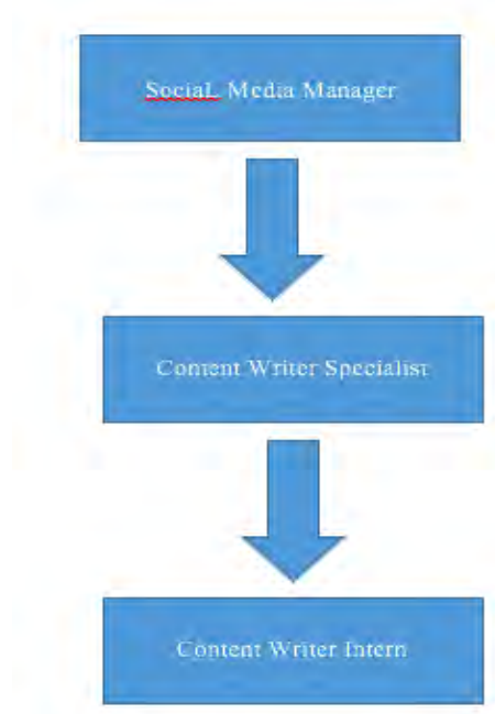
Gambar 2.6 Struktur Lingkup Kerja Terkait

Pada Seven Ads Indonesia, Content Writer merupakan salah satu divisi yang berada di bawah naungan konten media sosial konten. Di bawah ini merupakan struktur divisi konten media sosial: