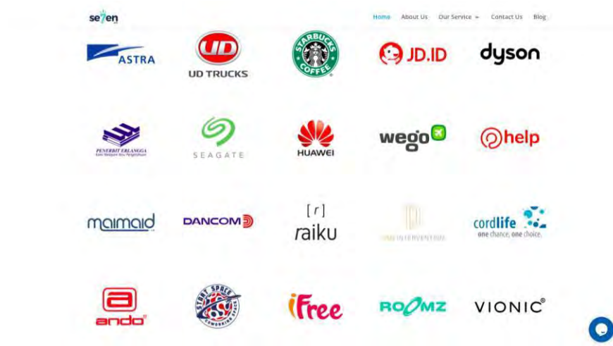
Gambar 2.3 Klien Seven Ads

memperluas target pasar dari sebuah produk klien, yaitu Instagram dan Facebook. Seven Ads sendiri sudah melayani banyak klien di bidang media sosial dan influencer marketing , di antaranya Astra, UD Trucks, Penerbit Erlangga, Seagate, Maimaid.id, Dancom, Ando, Starbucks, JD.ID, Huawei, Wego, Raiku, DSN Intervention, Ifree, Roomz, Dyson, Help, Cordlife, Vionic, Fandiego, Travel, BBSstore, Malops, dan Takecoi.