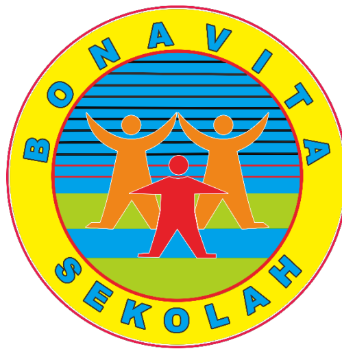
Gambar 2.1. Logo Yayasan Pendidikan Bonavita atau Sekolah Bonavita

dan SMK Bonavita melakukan pengembangan pendidikan dalam bentuk kerjasama dengan Mikrotik untuk memudahkan tenaga pendidik dan anak didik di Sekolah Bonavita dalam kegiatan belajar mengajar (KBM) yang menggunakan internet seperti lab komputer, lab native speakers , lab audio visual, dan lab desain grafis dan Sekolah Bonavita khususnya unit SMK jurusan Teknik Komputer dan Jaringan (TKJ) mengikuti lomba mendesain Mikrotik tahun 2018 dan bekerja sama dengan Mikrotik Academy sebagai sarana untuk pengembangan pembelajaran jurusan Teknik Komputer dan Jaringan di SMK Bonavita.