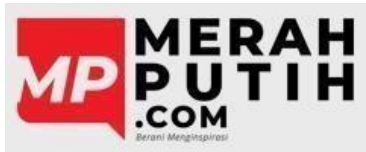
Gambar 2.1 - Logo Merahputih.com

Perusahaan yang menjadi tempat praktik kerja magang penulis adalah PT Merah Putih Media. Perusahaan media ini berdiri sejak Oktober 2014 lalu yang merupakan salah satu perusahaan di bawah JHL Group milik Jerry Hermawan Lo. Dengan tagline “Berani Menginspirasi”, PT Merah Putih Media berfokus untuk selalu menghadirkan informasi yang positif serta inspiratif kepada setiap pembaca (Merahputih.com, 2015, para. 1). PT Merah Putih Media juga mengutamakan penggunaan teknologi di setiap jenis aktivitas operasional di perusahaannya.