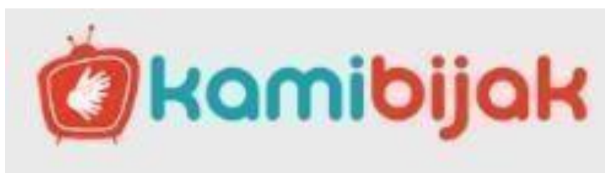
Gambar 2.5 - Logo Kamibijak

(SIDE.ID, 2017, para. 1). Media ini berfokus kepada informasi yang berada di sekitar kawasan tersebut, termasuk dengan informasi kebijakan pemerintahan, pembangunan kawasan, hingga seluruh bisnis, event , dan komunitas yang masuk ke dalam jangkauan kawasannya. Media ini juga dapat dikatakan sebagai media promosi yang bisa digunakan sebagai media partner untuk event atau pembuatan konten bisnis di wilayah terkait. Selain itu, SIDE.ID dan anak media dari PT Merah Putih lainnya bernaung pada investasi dari JHL Group sebagai salah satu cara untuk bertahan, dan juga sebagai model bisnis selain sebagai mediapartner .