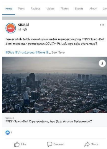
Gambar 3.3 – Unggahan Facebook SIDE.ID