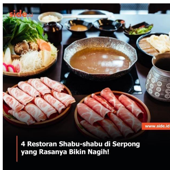
Gambar 3.1 – Feeds Instagram SIDE.ID