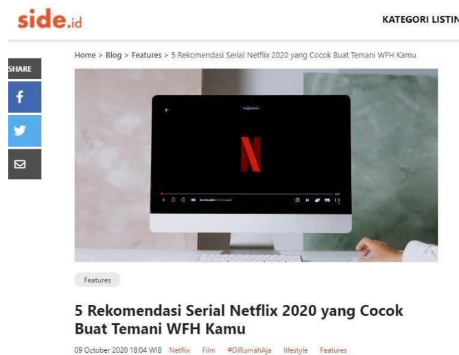
Gambar 3.3 - Artikel Tentang Netflix

biji kopi berdasarkan cita rasanya. Penulis mendapatkan pengetahuan yang lebih dalam tentang kopi setelah liputan ini sehingga bisa menulis artikel di atas.