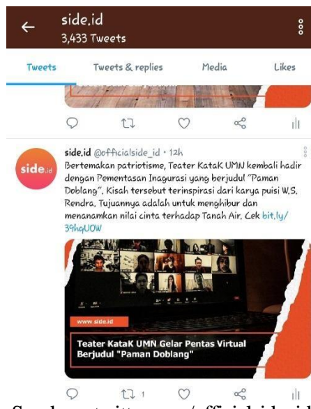
Gambar 3.4 –Unggahan Twitter SIDE.ID