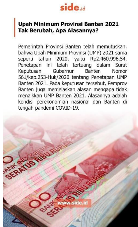
Gambar 3.2 – Story Instagram SIDE.ID

Konten yang diunggah di feeds Instagram adalah berita terbaru yang naik di website SIDE.ID setiap harinya. Jumlah artikel yang naik di website sebanyak 3-4 artikel setiap harinya, begitu pun dengan konten di feeds dan story Instagram, Facebook, dan Twitter SIDE.ID. Penulis diharuskan untuk mengirim gambar dan caption untuk feeds dan juga caption kepada