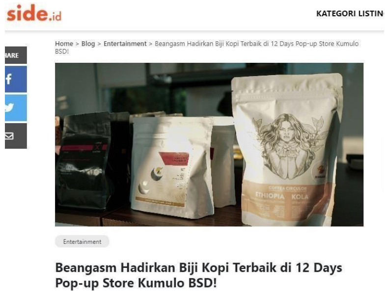
Gambar 3.2 - Liputan ke Pop Up Store Beangasm di Kumulo BSD City