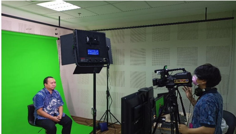
Gambar 3.1. Penulis sedang melaksanakan proses tapping

Setelah menyelesaikan proses tapping , penulis langsung melakukan backup data dari kartu memori kamera camcorder dan audio recorder ke Google Drive. Setelah itu, penulis langsung melakukan editing pada footage yang barusan di tapping dengan script yang tadi juga digunakan pada saat tapping sebagai acuan dalam mengedit.