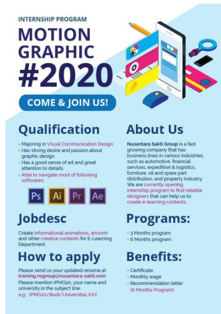
Gambar 1.1. Gambar lowongan magang NSS

Dua hari setelahnya, pada tanggal 23 september 2020 penulis mendapatkan email balasan dari Nusantara sakti grup. Yang berisi psikotes online dan data diri yang harus diselesaikan dan dikirim melalui email selambat nya pukul 10.00 pagi esok harinya tanggal 24 september.