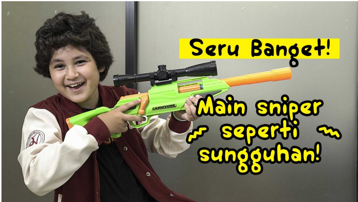
Gambar 3.3. Cover Kotak Mainan