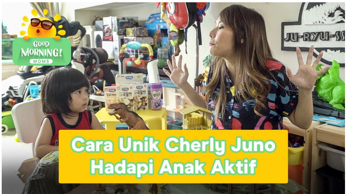
Gambar 3.2. Cover Good Morning Moms

Penulis melakukan pekerjaan menjadi Videographer untuk memproduksi konten - konten di media sosial perusahaan khususnya Youtube, program yang pernah dipegang oleh penulis diantaranya adalah Kotak Maianan, Buka Bukaan, Boba dan masih banyak lagi.