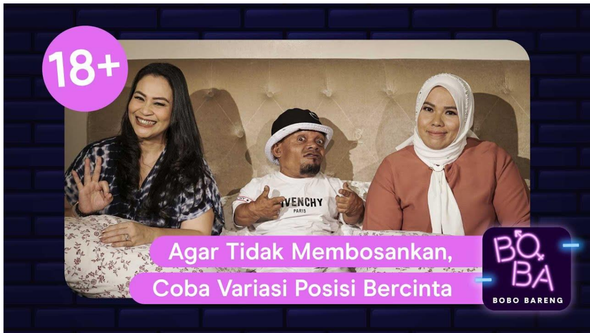
Gambar 3.4. Cover BoBa