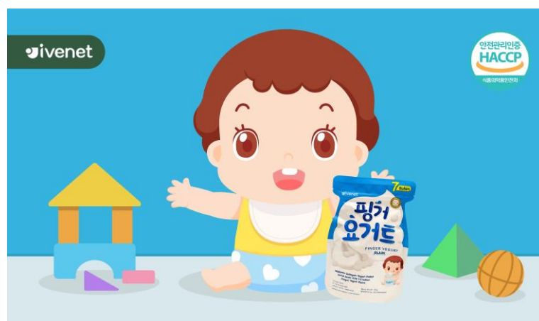
Gambar 2.5. Geniora Motion Ivenet Dokumentasi Perusahaan

Geniora in Motion merupakan hasil animasi yang diproduksi di Geniora Animation Studio. Berbagai proyek bersama dengan berbagai klien dan produk yang sudah dikerjakan oleh Geniora Animation Studio adalah Buds Organic, Ivenet, proyek Kemendikbud BDR (Belajar dari Rumah) TVRI untuk kelas 1 dan 2 SD, dan masih banyak proyek lainnya. Setiap hasil animasi yang dikerjakan dalam berbagai proyek menampilkan kualitas video yang terbaik dan sesuai dengan arahan brief yang diberikan oleh klien.