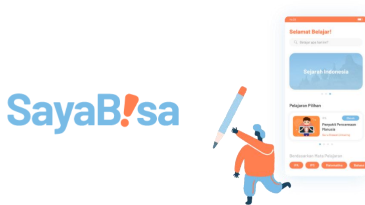
Gambar 2.2. Geniora Sayabisa Dokumentasi Perusahaan

Dalam merancang Geniora Phone bermula dimana Fredy Candra sedang mengikuti pameran teknologi pendidikan di Spanyol dan tertarik dengan hasil presentasi salah seseorang yang memiliki visi dan misi yang sama di bidang pendidikan, dan sekarang menjadi partner Geniora dalam membentuk rancangan software untuk Geniora Phone . Dimana pada saat itu sedang menjelaskan mengenai penggunaan smartphone yang dikenal sebagai media entertainment namun ternyata dapat digunakan sebagai alat yang dapat mendukung anak-anak dan membangun komunikasi antara orang tua dengan anak.