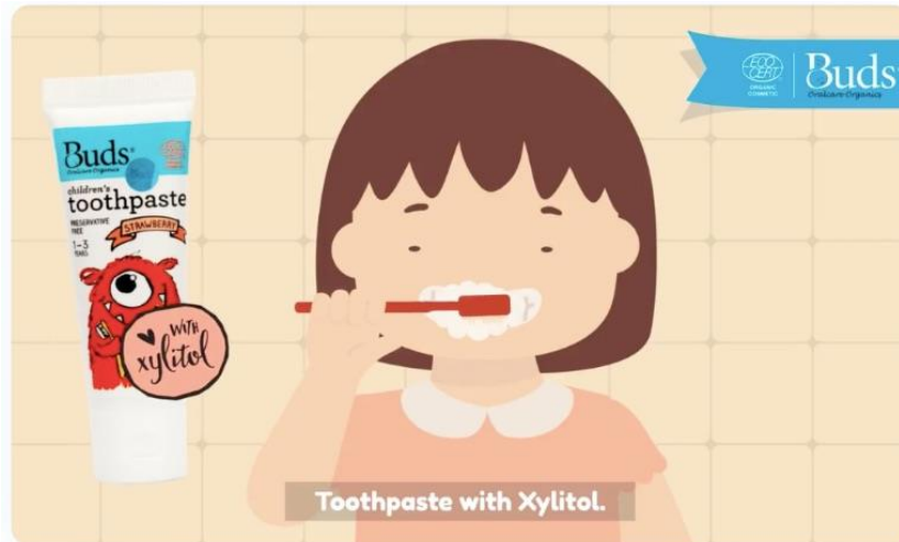
Gambar 2.4. Geniora Motion Buds Organic Dokumentasi Perusahaan

Geniora in Motion merupakan hasil animasi yang diproduksi di Geniora Animation Studio. Berbagai proyek bersama dengan berbagai klien dan produk yang sudah dikerjakan oleh Geniora Animation Studio adalah Buds Organic, Ivenet, proyek Kemendikbud BDR (Belajar dari Rumah) TVRI untuk kelas 1 dan 2 SD, dan masih banyak proyek lainnya. Setiap hasil animasi yang dikerjakan dalam berbagai proyek menampilkan kualitas video yang terbaik dan sesuai dengan arahan brief yang diberikan oleh klien.