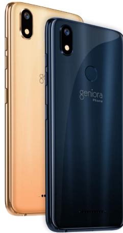
Gambar 2.3. Geniora Phone Dokumentasi Perusahaan

Geniora Phone merupakan smartphone pertama bagi anak yang hadir karena kepedulian Geniora terhadap keluarga yang merupakan lembaga pertama dalam kehidupan setiap orang. Geniora Phone memfasilitasi keluarga dalam mendidik anak-anak di era digital sekarang ini, serta dapat membangun hubungan jembatan antara orang tua dengan anak-anak dalam aktivitas sehari-hari dengan menerapkan penggunaan teknologi. Geniora Phone menjadi satu-satunya smartphone untuk anak di Asia yang dilengkapi dengan fitur-fitur modern yang pastinya dapat membantu orang tua dalam mendampingi anak-anak untuk menggunakan smartphone nya. Kelebihan yang dimiliki Geniora Phone selain memiliki fitur-fitur modern , Geniora Phone memiliki sistem parenting yang tidak dapat di uninstall dan dapat diawasi secara langsung oleh orang tua. Fitur-fitur yang hanya dapat ditemui pada Geniora Phone yaitu, Ayo Dengarkan merupakan interupsi aktivitas smartphone anak diawasi secara langsung oleh orang tua, Proteksi SOS yaitu, panggilan darurat yang dapat dilakukan oleh anak saat membutuhkan pertolongan, Geolokasi merupakan keberadaan posisi anak saat berpergian dapat dengan mudah dijangkau oleh orangtua, Belajar tertib dengan jadwal dapat membantu orang tua dan anak untuk tertib dalam mengatur jadwal, dan orang tua dapat dengan mudah memunculkan atau menyembunyikan aplikasi apa saja yang perlu digunakan oleh anak-anak.