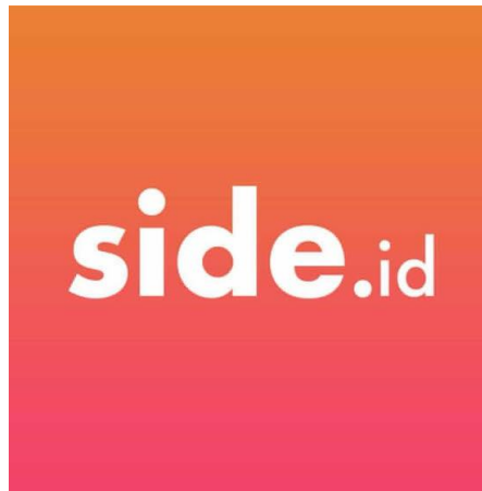
Gambar 2.2 Logo Side.id