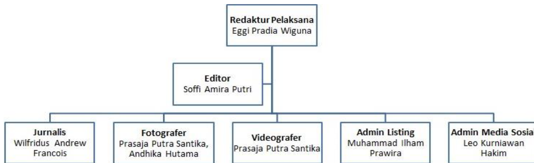
Gambar 2.2 Struktur Organisasi Side.id