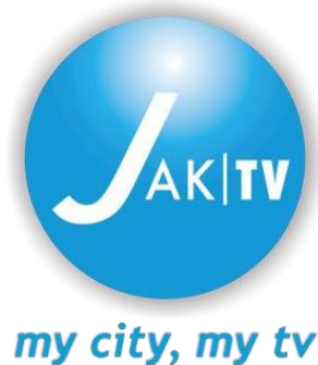
Gambar 2.1 Logo Pertama JAKTV pada Tahun 2004

JAKTV telah mengganti logonya sebanyak 3. Logo ini diganti dengan bentuk dan warna berbeda. Berikut perkembangan logo JAKTV sejak 2004 hingga saat ini.