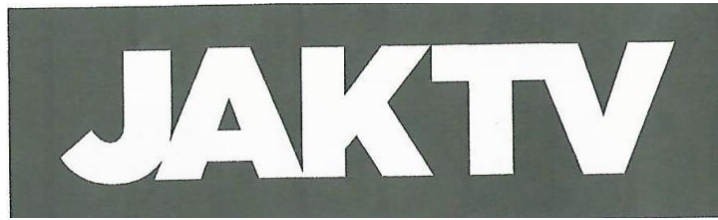
Gambar 2.4 Logo Berwarna Solid Putih JAKTV.