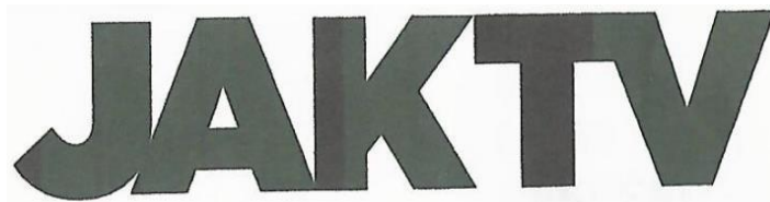
Gambar 2.5 Logo Berwarna Hitam JAKTV.

Gambar 2.4 menampilkan logo JAKTV dengan warna putih solid. Untuk logo berwarna solid putih digunakan diatas warna hitam dan biru serta digunakan pada warna turunan gelap color id . Logo ini digunakan untuk kebutuhan On-air .