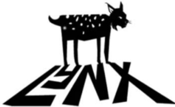
Gambar 2.1. Logo Lynx Films