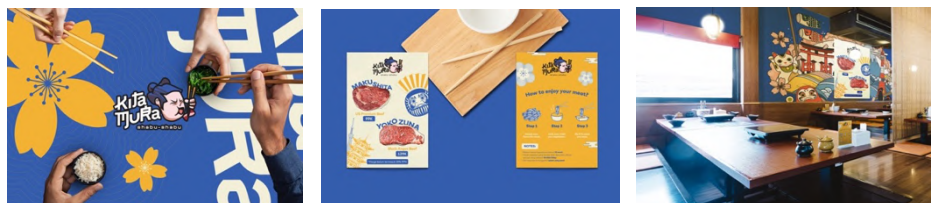
Gambar 2.3. Portfolio EGGHEAD: Kitamura