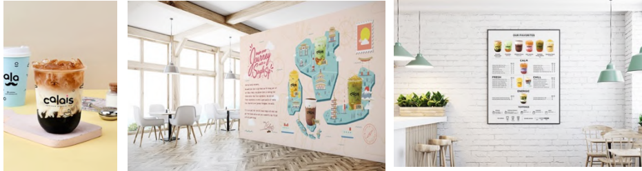
Gambar 2.2. Portfolio EGGHEAD: Calais