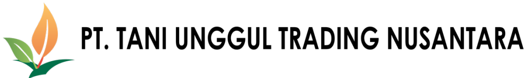
Gambar 2.1. Logo PT Tani Unggul Trading Nusantara

kemudian dipasarkan dengan kualitas internasional, Memberikan semua orang akses untuk mendapatkan sayuran terjangkau, segar, dan sehat, Berinvestasi dalam pengembangan produk demi hasil sayur yang unggul, dan Membangun brand yang dapat dipercaya.