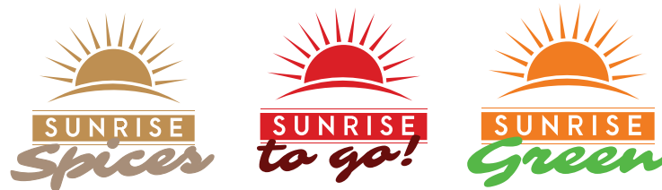
Gambar 2.3. Logo Sunrise Spices, to go, dan Green

Kemudian Brand unggulan PT Tani Unggul Trading Nusantara ini memiliki beberapa anakan dari Sunrise yaitu Sunrise Spices, Sunrise to go dan Sunrise Green.