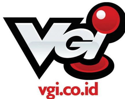
Gambar 2.1. Logo Video Game Indonesia (PT VGI Digital, 2021)

PT VGI Digital Indonesia merupakan perusahaan yang bergerak di bidang digital dan produksi video. Sesuai dengan wawancara dengan Bapak Patra Ramadana, awalnya VGI bukanlah Visi Global Interaktif, melainkan Video Game Indonesia.