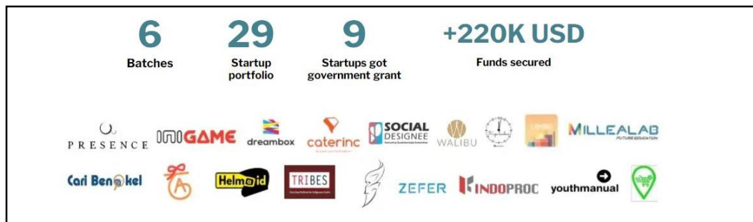
Gambar 2.2 Hasil incubation program (Sumber : Dokumentasi Internal Skystar)