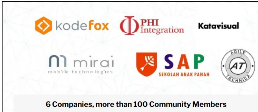
Gambar 2.3 Member komunitas Skystar Ventures