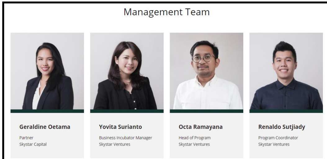
Gambar 2.5 Komponen organisasi Skystar Ventures 1