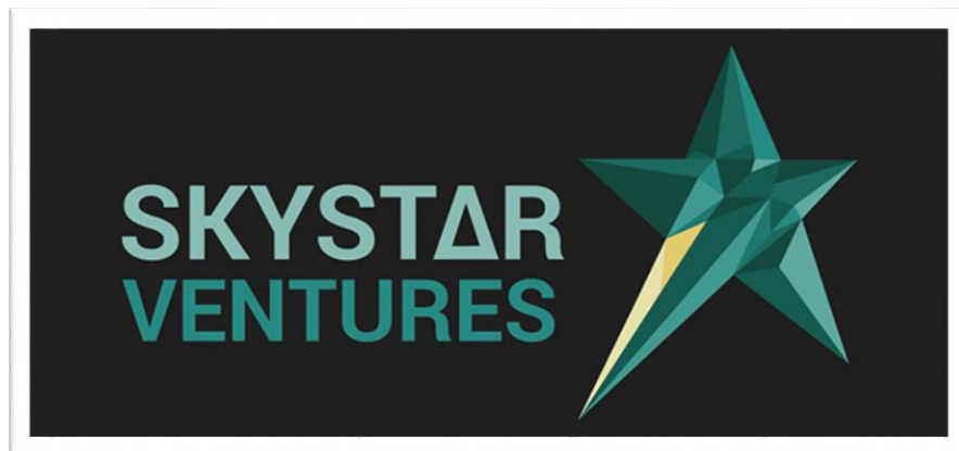
Gambar 2.1 Logo perusahaan Skystar Ventures

Skystar Ventures adalah sebuah Tech Incubator dan Community Driven space yang berdiri pada tahun 2013. Didirikan oleh pihak Universitas Multimedia Nusantara (UMN) dan Kompas Gramedia Group (KGG). Skystar Ventures membantu Incubate Startup berbasis teknologi dengan menghubungkan mentor dengan mentee yang terkait, dan menyediakan collaborative working space yang dapat digunakan oleh mahasiswa Skypreneur atau anggota Skypreneur lainnya. Saat ini Skystar Ventures telah Incubate 29 startup , bergabung dengan Global Accelerator Network dan Tech in asia, dan salah satu partner dari Ristekdikti. Gambar 2.1 merupakan logo Skystar Ventures yang digunakan.