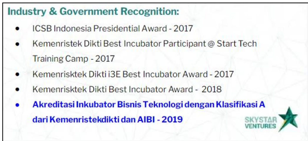
Gambar 2. 4 Penghargaan Skystar Ventures