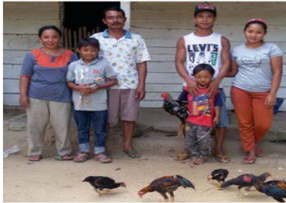
Gambar 2.6 Pemberian Bantuan Modal Usaha Proyek APGRA