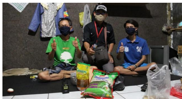
Gambar 2.5 Pembagian Sembako oleh tim misi