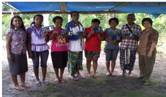
Gambar 2.4 Distribusi Radio Proyek Yaski Peduli

Keempat ialah projek Aid Program for God Servant in Remote Area (APGRA) , yaitu projek dimana YASKI beserta dukungan dari para donatur dan pendengar Radio Heartline memberikan bantuan berupa pemberian modal usaha kecil untuk para pelayan Tuhan yang tinggal di pelosok daerah dan pelatihan budidaya ternak serta bercocok tanam agar mereka dapat mengelola usaha tersebut dan memenuhi kebutuhan hidup sehari-hari. Sejak tahun 2000, projek ini berhasil membantu lebih dari 11.000 pelayan Tuhan.