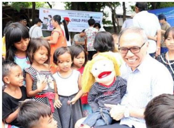
Gambar 2.7 Pembawaan dongeng dari YASKI di panti asuhan dalam projek ASAI

Kelima ialah projek Aku Sayang Anak Indonesia (ASAI) , yaitu sebuah projek untuk melindungi masa depan generasi anak Indonesia yang tidak dapat atau putus sekolah karena harus bekerja, mereka yang mendapat kekerasan fisik dan seksual, pedofilia, narkoba dan lainnya. YASKI kerap memberikan bantuan melalui penyaluran beasiswa kepada lebih dari 4.000 anak yang kurang mampu dan akan terus bertambah dengan harapan mereka dapat melanjutkan sekolah dan menggapai cita-cita yang nantinya akan membawa harum nama bangsa dan negara. YASKI juga memberikan penyuluhan positif kepada orang tua dan anak, agar para keluarga tidak terjerumus ke dalam konflik yang berakibat pada perceraian dan berdampak pada kondisi mental anak. Selain itu, YASKI juga menyajikan siaran edukasi lewat radio mengenai keluarga, dan media sosial serta membuka pelayanan konseling lainnya.