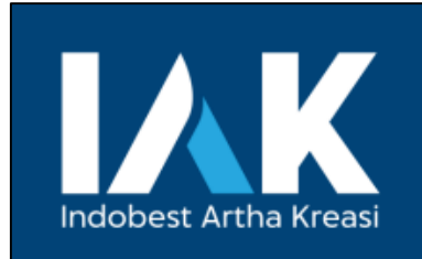
Gambar 2.1 Logo PT Indobest Artha Kreasi