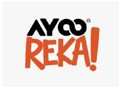
Gambar 2.4. Logo Ayoo Reka (Ayoo Kreasi, 2021)

Ayoo Kreasi berusaha untuk membantu klien dalam meningkatkan brand awareness dan customer engagement IP terkait. Solusi-solusi yang ditawarkan bersifat digital creative solution berupa: