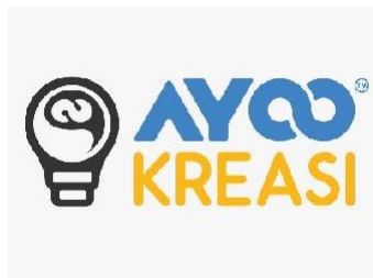
Gambar 2.1. Logo Ayoo Kreasi (Ayoo Kreasi, 2021)

Ayoo Kreasi menghubungkan pemilik IP dengan pelaku industri lain dan juga investor. Visi Ayoo Kreasi adalah menjadi perusahaan kreatif berskala global yang berorientasi pada teknologi dan memiliki jaringan yang kuat dan berbobot. Selain itu, Ayoo Kreasi juga melakukan kegiatan yang menyangkut sumber daya manusia, seperti pelatihan dan seminar (Ayoo Kreasi, 2021, ayookreasi.com ).