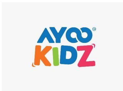
Gambar 2.3. Logo Ayoo Kidz (Ayoo Kreasi, 2021)