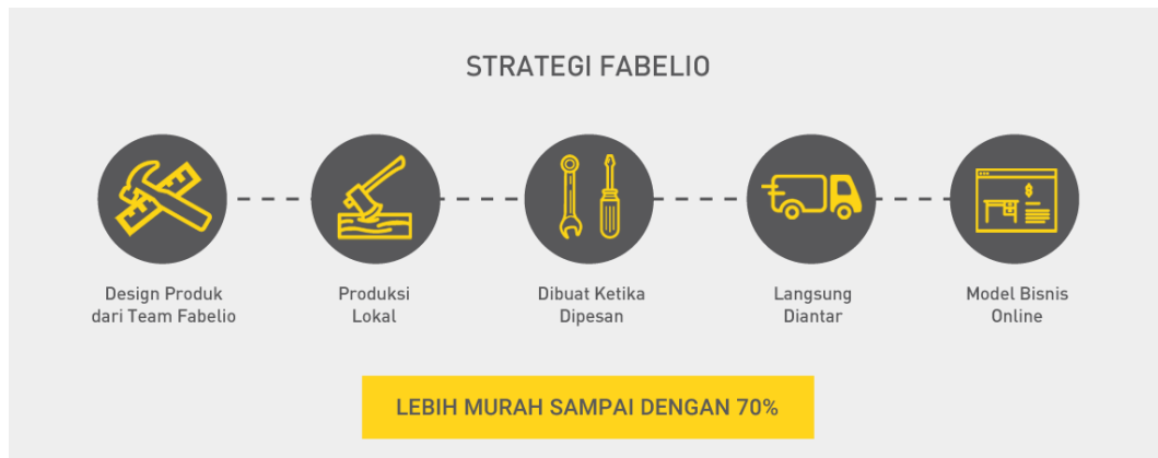
Gambar 2.2. Strategi Bisnis Fabelio