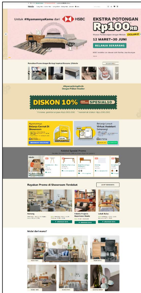
Gambar 2.4. Tampilan Website fabelio.com

Gambar 2.4 menunjukkan produk utama dari Fabelio, yaitu website e-commerce dari Fabelio yang ditujukan untuk melakukan transaksi jual beli, mulai dari pemesanan, pembayaran, pelacakan pesanan, layanan purna jual, pelayanan pelanggan secara online .