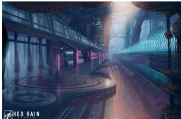
Gambar 2.6. Lunar Punk Transportation Key Art

Selain membuat aset untuk game , RedRain Studio memiliki jasa untuk membuat ilustrasi dan konsep 2d. Berikut adalah contoh 2d konsep environment dari RedRain Studio.