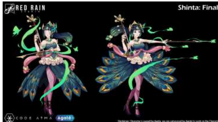
Gambar 2.5. Aset Game Untuk Project Atma