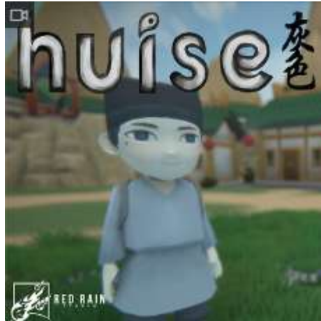
Gambar 2.7. Programming Game Hui'se