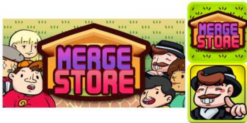
Gambar 2.4. Merge Store

Selain game Tiles of Waktu, RedRain juga memiliki game orisinal lainnya seperti Merge Store: Idle Tap Tycoon. Game berjalan pada platform mobile yang dirilis pada tahun 2019. Merge Store adalah game kasual dan simulasi sebagai walikota yang mengatur kotanya dengan membuka toko dan menggabung-gabungkan level yang sama.