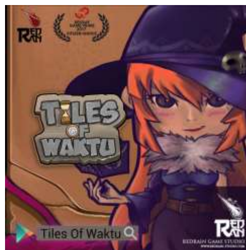
Gambar 2.3. Tiles of Waktu

Game orisinal dari RedRain Studio yang pertama adalah Tiles of Waktu. Game tersebut memenangkan citizen's award pada tahun 2017 di GamePrime 2017. Tiles of Waktu adalah game puzzle pada platform mobile yang menggunakan elemen role playing game di dalamnya. Untuk memainkan game ini, pemain hanya perlu mencocokkan tiles yang disediakan dengan tiles yang ditampilkan di tengah layar dengan waktu yang ditentukan.