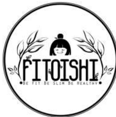
Gambar 2.8. Logo Fitoishi

Selain memiliki permintaan klien untuk pengembangan game , RedRain Studio juga memiliki jasa untuk membuat desain sebuah brand seperti logo game maupun logo perusahaan lainnya.