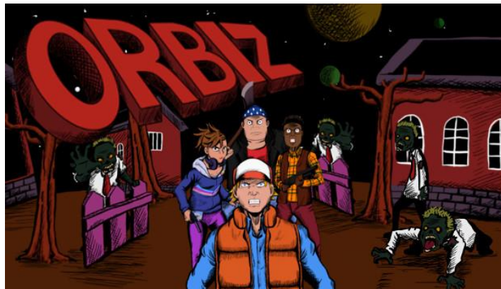
Gambar 2.2. Orbiz

Produk dalam kategori desktop games yaitu Orbiz , local coop multiplayer games yang sudah mendapatkan berbagai macam penghargaan. Game ini sudah dirilis dan tersedia di Steam.