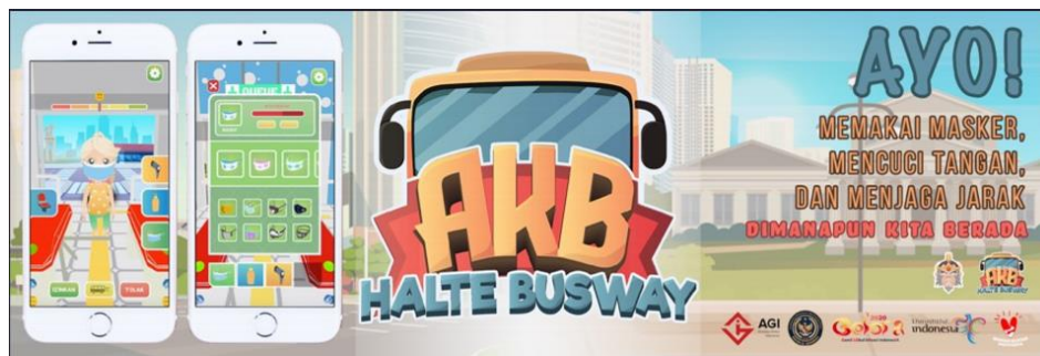
Gambar 2.4. AKB Halte Busway

Mahabarat Warriors merupakan game 2D mobile line-up defense yang terinspirasi dari kisah petarungan Mahabarata dimana pemain mengarahkan para Pejuang Mahabarata dan pasukan Pandawa melawan Kurawa.