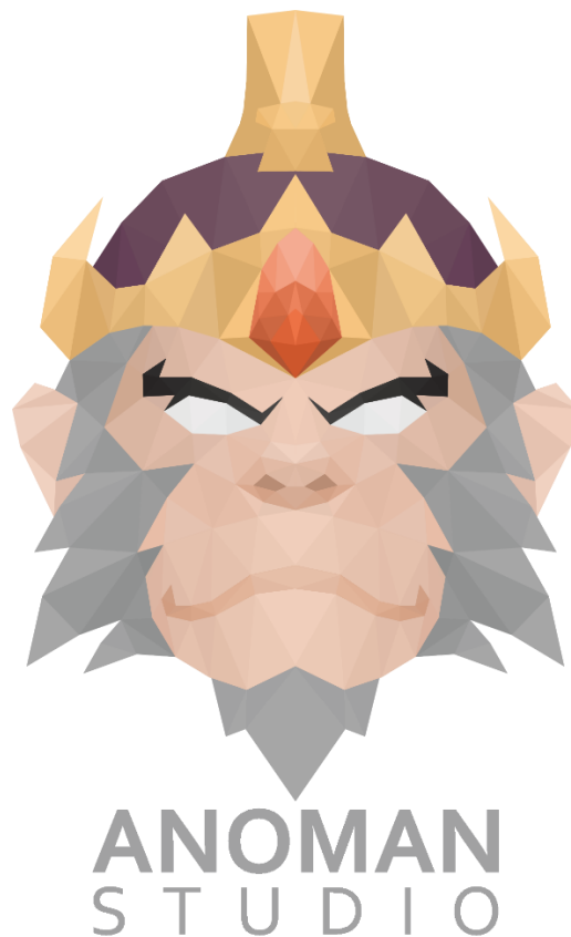
Gambar 2.1. Logo Anoman Studio