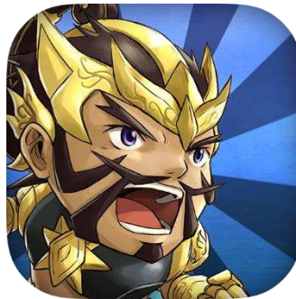
Gambar 2.3. Mahabarat Warriors

Dalam kategori ini terdapat produk mobile games Mahabarat Warriors dan AKB Halte Busway.