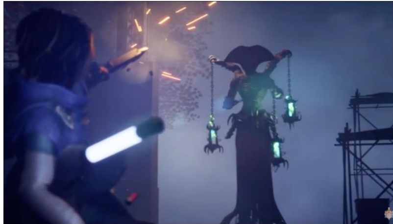
Gambar 2.5. Project Darma

Dalam kategori ini terdapat produk animasi Project Darma dan Raja Kuis.