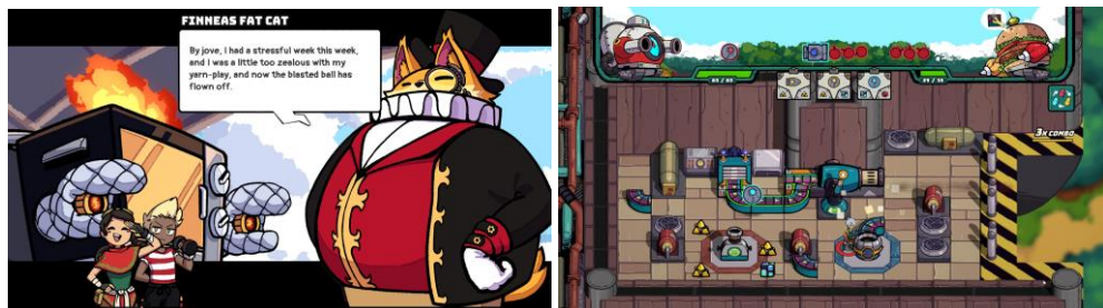
Gambar 2.5. ConnecTank

ConnecTank merupakan game multiplayer battle-puzzle yang berfokus pada tank building dan kerjasama tim. Pemain dengan maksimal 4 orang harus menghubungkan conveyor belt , memproduksi amunisi agar tank dapat menembakkan serangan ke lawan, dan memperbaiki conveyor yang rusak agar suplai amunisi dapat terus berjalan. Bekerja sama dengan YummyYummyTummy dan penerbit Natsume, ConnecTank direncanakan akan dirilis di berbagai platform seperti Nintendo Switch, PlayStation 4, Xbox One dan PC.