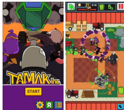
Gambar 2.4. Tamak Inc.

kantor dan menuntut hak atas gaji mereka. Pemain bertugas untuk menghalau karyawan dan melindungi harta benda dari serangan karyawan yang marah menggunakan karakter-karakter yang unik dan menarik. Tamak Inc. dirilis pada 1 September 2017 untuk platform Android.