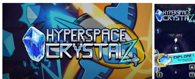
Gambar 2.3. Hyperspace Crystalz

Hyperspace Crystalz merupakan game casual arcade bertemakan luar angkasa. Pemain diminta untuk mengumpulkan kristal-kristal yang akan digunakan sebagai sumber energi kapal luar angkasa mereka. Pemain harus bertahan hidup selama mungkin dengan mengumpulkan kristal sambil menghindari benda-benda berbahaya di luar angkasa. Hyperspace Crystalz dirilis pada 9 Desember 2016 untuk platform Android.