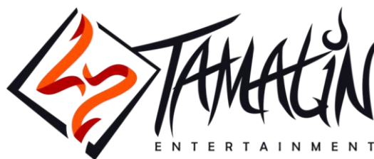
Gambar 2.1. Logo Tamatin ( https://tamatin.team/ )