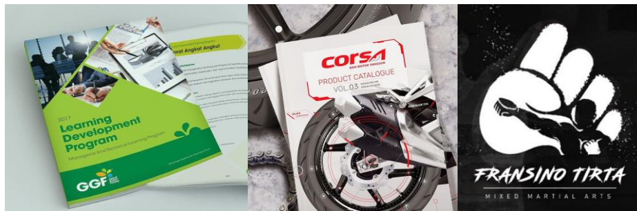
Gambar 2.1. Beberapa Contoh Portofolio Desain Grafis dari Maple Creative (Maple Creative, 2021)

Maple Creative merupakan agensi kreatif desain interior dan grafis yang berlokasi di Rukan Colombus A9, Jl. Green Lake City Boulevard, RT.002/RW.009, Petir, Cipondoh, Tangerang City. Nama Maple menurut penjelasan pemilik perusahaan, Albert Sutedja (wawancara, 2021), berasal dari pohon dengan nama yang sama karena ciri khas bentuk daun yang unik.