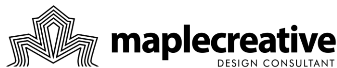
Gambar 2.2. Logo Maple Creative

pembuatan website . Pada penghujung tahun tersebut, perusahaan kemudian memperluas lagi bidang pekerjaan kepada dunia desain interior. Maple Creative kemudian menargetkan interior perumahan ( residential ), perkantoran, dan area komersial sebagai target pasarannya. Perusahaan melakukan jasa konsultasi desain terlebih dahulu sebelum memasuki bidang produksi interior berbentuk desain 3D sehingga perusahaan mengategorikan diri sebagai perusahaan “ interior consultant & production ”.