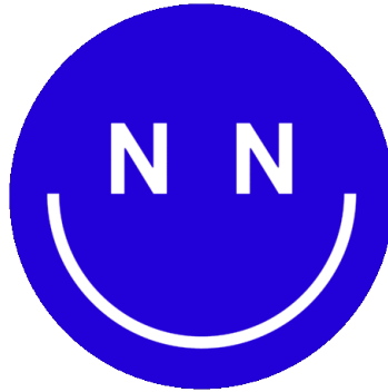
Gambar 2.3 Icon Naisu Studio