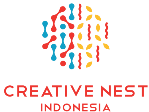
Gambar 2 Logo Perusahaan Creative Nest Indonesia