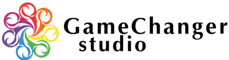
Gambar 2.1. Logo GameChanger studio

GameChanger studio memiliki visi untuk menjadi sumber inspirasi dan inovasi dalam dunia industri kreatif serta misi untuk membangun studio game yang berkelanjutan dan terus berkembang melalui banyak generasi. Juga untuk membuat game yang dikenal secara mendunia dalam industri game dan memiliki brand dan IP yang cukup dikenal dalam industri entertainment .