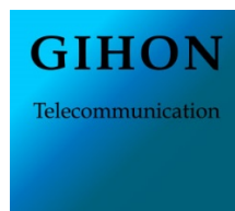
Gambar 2. 1 Logo PT Gihon Telekomunikasi Indonesia Tbk

PT Gihon Telekomunikasi Indonesia telah berdiri sejak tanggal 27 april 2001 di Jakarta. Bidang usaha utama dari PT Gihon Telekomunikasi Indonesia Tbk adalah bidang Tower Telekomunikasi. Tim inti dari PT Gihon Telekomunikasi Indonesia Tbk telah memiliki pengalaman sejak tahun 1996 pada bidang Tower dan Selular Industri. Hingga saat ini PT Gihon Telekomunikasi Indonesia Tbk telah menjadi perusahaan investasi dengan Portofolio pada bidang Industri Leasing Tower, Utilitas, Mikrokontroler, Serat Optik dan Jaringan Aktif. Layanan utama PT Gihon Telekomunikasi Indonesia meliputi Jasa Teknik, Desain, Konstruksi, Instalasi dan Integrasi Jaringan, yang didedikasikan untuk Industri Telekomunikasi. (HRD, 2020). Logo dari PT Gihon Telekomunikasi Indonesia dapat dilihat pada gambar 2.1.