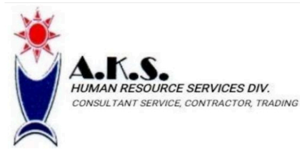
Gambar 2.1 Logo PT Andamar Karisma Sejahtera

berperilaku dapat mengajukan bimbingan konseling dengan psikolog yang disediakan oleh PT Andamar.