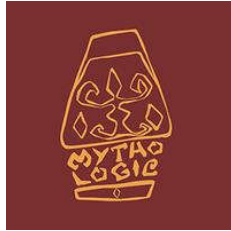
Gambar 2.1. Logo Mythologic Studio