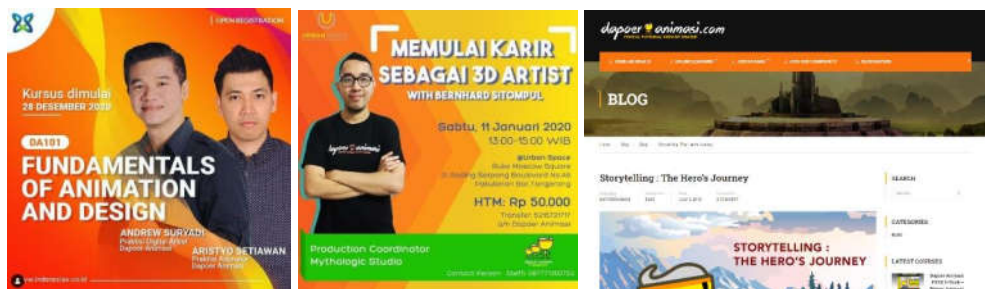
Gambar 2.3. Contoh Konten Instagram dan Juga Website Dapoer Animasi

Divisi edukasi non-formal yaitu Dapoer Animasi sendiri merupakan perwujudan dari misi perusahaan yaitu untuk meningkatkan kualitas SDM dalam industri animasi. Karena itu, Dapoer Animasi sendiri ada dengan tujuan untuk membuat pembelajaran animasi yang dapat diakses bagi masyarakat umum, juga menyampaikan materi yang relevan dan up-to-date sesuai standar industri animasi sekarang. Dari logo Dapoer Animasi sendiri, digunakan sebuah maskot bergambar mangkok yang mengeluarkan aroma di atasnya (yang nampak seperti rambut), juga digambarkan dengan kaki dan tangan. Menurut B. Sitompul, maskot yaitu karakter berbentuk mangkok ini dianalogikan sebagai Dapoer Animasi yang merupakan wadah dari ilmu-ilmu animasi, sementara aroma di atasnya adalah ilmu-ilmu animasi yang disajikan oleh Dapoer Animasi selalu relevan dengan perkembangan industri animasi. Ilmu-ilmu yang diajarkan Dapoer Animasi pun menurut beliau dapat diminati dan dimengerti oleh masyarakat yang belajar (Sitompul, wawancara pribadi, 25 Februari, 2021).