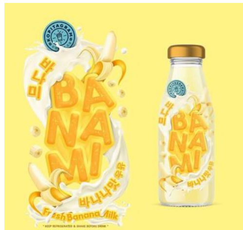
Gambar 2.2 Portofolio GiFU.Studio: BANANAMI Kopitagram

Selama praktik kerja internship , penulis dan para tim GiFU.Studio diminta untuk mempersiapkan presentasi terkait pengetahuan umum baik dibidang desain, dunia perfilman, ilmu komunikasi, ilmu marketing dan lain sebagainya. Materi yang sudah dibuat harus melakukan tahap approval kepada pihak Creative Director kemudian akan dipresentasikan didepan ruang kerja yang bergilir disetiap minggunya, oleh tim GiFU.Studio termasuk penulis.