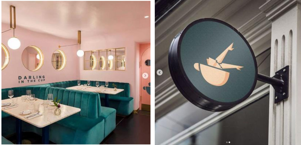
Gambar 2.3 Portofolio GiFU.Studio: Darling in the cup