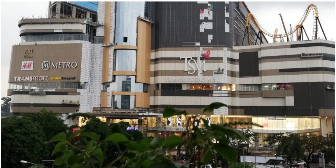
Gambar 2.1 Trans Studio Mal Cibubur