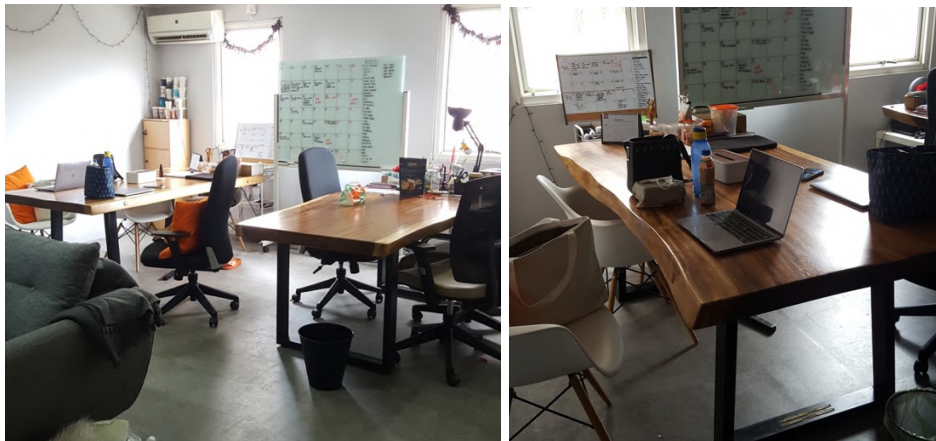
Gambar 2.4. Suasana Studio Moetual

Cereal Monsta bergerak di bidang food and beverages . Mereka menjual kue, susu hingga cereal bar dengan varian yang beragam. Cereal Monsta digambarkan dengan anjing Shiba Inu dan sesosok monster misterius yang senang berbagi makanan. Color palette Cereal Monsta tersusun atas warna krem, abu – abu muda, dan coklat yang juga menggambarkan produk mereka sekaligus menampilkan brand yang fun namun tetap modern. Selain kedua brand diatas, Moetual juga merancang beberapa brand dalam bidang usaha lainnya seperti Friends of Sally yang bergerak di bidang pakaian anak, Ayam Pusaka Abadi yang merupakan restoran cepat saji, hingga Moro coffee shop .