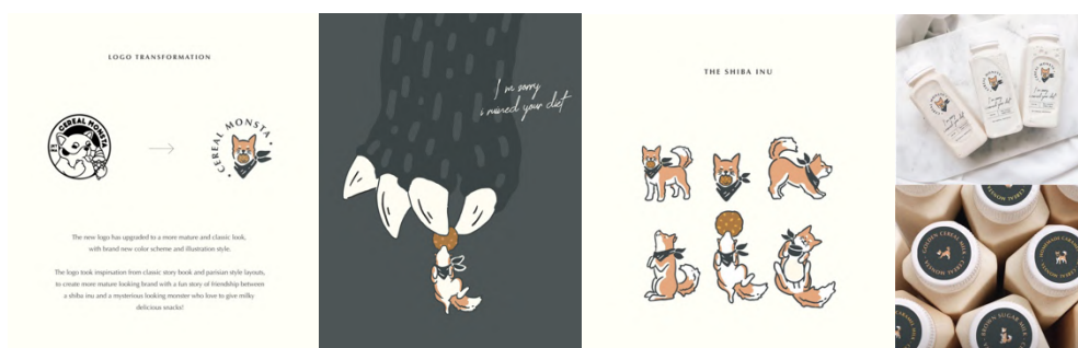
Gambar 2.3. Branding Cereal Monsta

Syca merupakan brand kosmetik lokal yang hadir untuk mendorong setiap perempuan untuk lebih mencintai diri dengan kecantikan mereka sendiri. Menghadirkan value yang eco-friendly dan easy to use , Syca mengedepankan produk yang nyaman digunakan untuk seluruh perempuan agar mengingatkan kepercayaan diri bahwa setiap perempuan berharga. Syca lebih dari sekedar brand , mereka membangun komunitas yang positif bagi para konsumennya. Maka, identitas Syca dibuat dengan wordmark yang modern, dengan huruf 'Y' yang membentuk ilustrasi bibir dan lipstick . Keseluruhan warna dan layout menunjukkan bahwa Syca adalah brand yang ramah, natural , dan affordable .