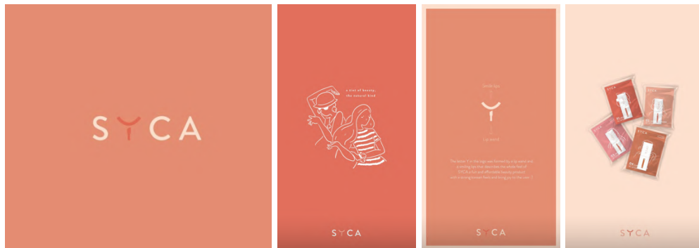
Gambar 2.2. Branding Syca

Beberapa proyek branding yang pernah ditangani oleh Moetual Branding & Creative Works adalah Syca dan Cereal Monsta. Dari kedua brand tersebut, dapat terlihat bahwa Moetual mampu merancang berbagai konsep branding yang menyesuaikan dengan bidang usaha dengan sentuhan ilustrasi mereka.