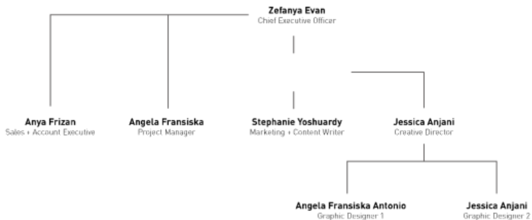
Gambar 2.2. Struktur Organisasi Arterie Studio (Dokumentasi resmi milik perusahaan, 2021)

Arterie Studio memiliki struktur organisasi yang berlaku untuk mencapai alur kerja yang jelas dan efektif. Struktur yang telah berjalan memastikan alur koordinasi yang sistematis sesuai dengan kedudukan serta peran setiap individu. Selama praktek kerja magang dilakukan, penulis berada langsung dibawah supervisi Creative Director sehingga menerima seluruh arahan pengerjaan proyek dari beliau. Setelah pengerjaan proyek dilakukan, penulis berkoordinasi langsung dengan Account Executive/Project Manager yang berhubungan langsung dengan klien. Feedback dari klien juga akan disampaikan oleh Account Executive/Project Manager dan penulis akan kembali melakukan perbaikan sesuai dengan revisi yang disampaikan agar sesuai dengan objektif dari proyek. Berikut merupakan struktur organisasi yang berlaku di Arterie Studio selama praktek kerja magang yang telah dilakukan oleh penulis.