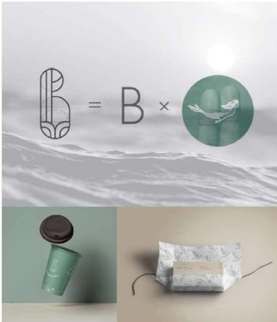
Gambar 2.5. Proyek The Bare Bottle Oleh Arterie Studio ( https://www.arteriestudio.com/thebarebottle )

desain Craft Botanics dibuat maskulin namun tetap terlihat ramah bagi target. Hasil perancangan identitas memperlihatkan kesan natural dan alami sesuai dengan bahan pembuatan produk melalui ilustrasi tumbuhan sederhana. Desain identitas untuk Craft Botanics kemudian diterapkan pada beberapa label packaging untuk botol Gin dari Craft Botanics. (Arterie Studio, 2019).