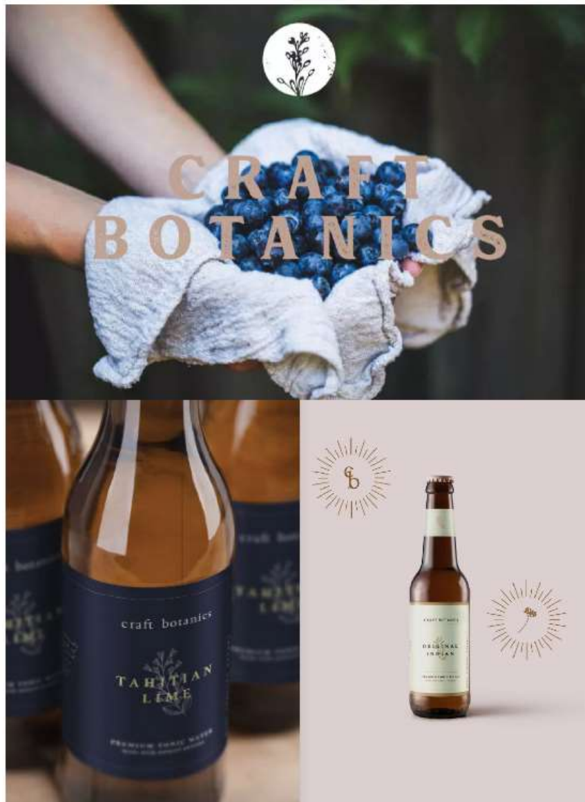
Gambar 2.4. Proyek Craft Botanics Oleh Arterie Studio ( https://www.arteriestudio.com/craft-botanics )

Bidang yang paling unggul dari Arterie merupakan branding identity . Berikut merupakan beberapa hasil dari proyek yang telah dikerjakan Arterie Studio berupa perancangan identitas untuk Craft Botanics, perancangan identitas untuk The Bare Bottle, dan perancangan identitas untuk Agra Karya Gumilang.