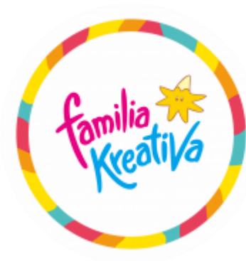
Gambar 2.2. Logo Familia Kreativa ( https://familiakreativa.com )