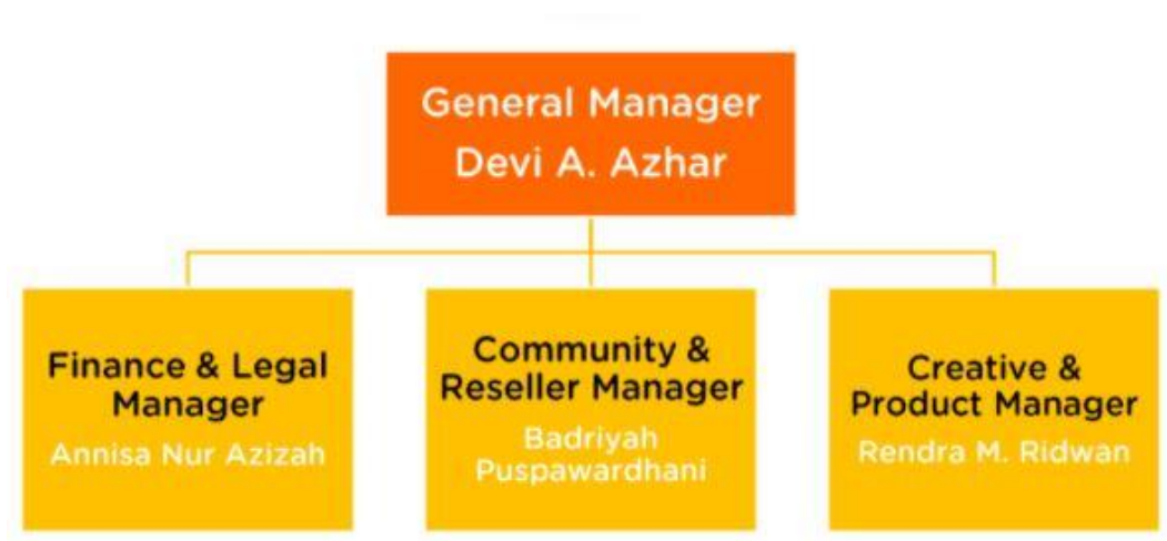
Tabel 2.1. Struktur Organisasi Familia Kreativa

Berikut adalah struktur organisasi pada Familia Kreativa :