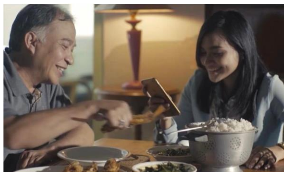
Gambar 2.4 TVC GOJEK

PT Future Mediatrix Group membuat konsep video yang berlatar waktu Ramadhan. Melalui video ini, PT Future Mediatrix Group bertujuan menyentuh audiens dengan pesan sederhana.