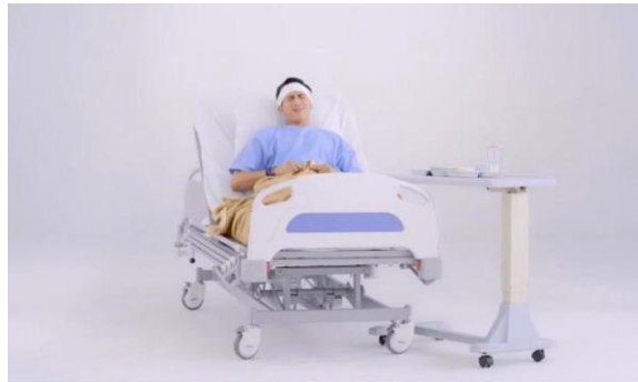
Gambar 2.3 TVC CIMB NIAGA

PT Future Mediatrix Group mengembangkan konsep iklan televisi CIMB Niaga yang lucu, namun efektif dalam menyampaikan pesan.