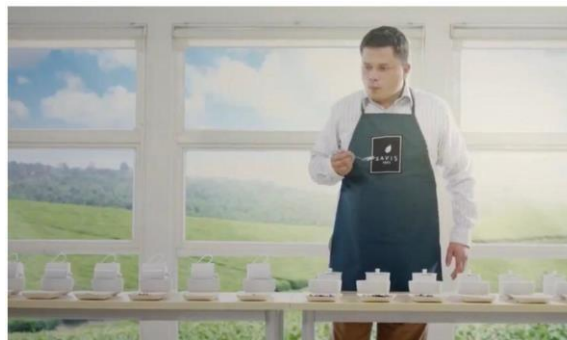
Gambar 2.2 TVC Savis Tea

PT Future Mediatrix membantu Savis Tea dalam mengembangkan TVC nya dengan menggunakan tema yang terinspirasi dari kekayaan alam Indonesia yang melahirkan kebaikan dalam secangkir the.