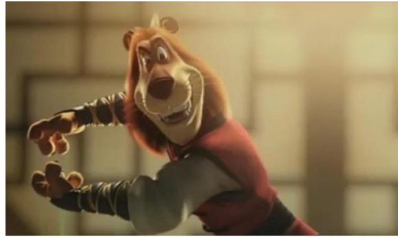
Gambar 2.5 TVC PADDLE POP

PT Future Mediatrix Group membangun cerita dan karakter yang akan disukai oleh target pasar Paddle Pop.