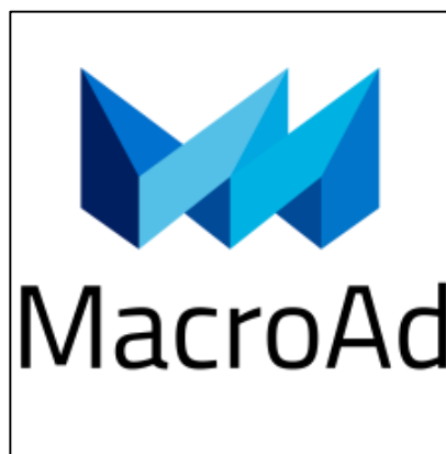
Gambar 2.1 Logo MacroAd

PT. Pulau Pulau Media (MacroAd) merupakan perusahaan yang bergerak di bidang periklanan di Indonesia. Produk MacroAd merupakan iklan yang berada di pinggiran jalan ( videotron, lightbox, toll gate ) dan commuter line . Lokasi kantor pusat MacroAd berada di Fatmawati Mas, Kav. 328 ± 329, Jl. RS. Fatmawati, Cilandak, Jakarta Selatan. Target pasar MacroAd merupakan perusahaan korporat yang ingin memasarkan produknya. Sekarang jumlah karyawan tetap sekitar 110 orang, 80 berada di kantor pusat dan 30 lainnya berada di kantor cabang.