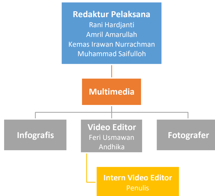
Gambar 2.3 Bagan Struktur Divisi Multimedia Okezone.com