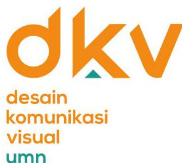
Gambar 2.2. Logo DKV

Visi Misi DKV UMN tertera pada dkv.umn.ac.id (2021), yaitu memiliki visi untuk menjadi lulusan DKV yang kreatif, inovatif, kompeten dan berorientasi internasional dengan fokus untuk mengembangkan visual media baru berdasarkan ICT, berjiwa wirausaha dan berbudi pekerti luhur. DKV UMN juga memiliki tiga misi, yaitu: