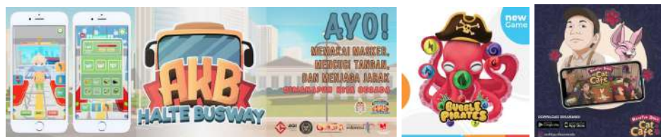
Gambar 2.4. Game Mobile Anoman Studio

Selain itu, Anoman Studio juga mengembangkan game mobile lainnya. Game tersebut seperti “AKB Halte Busway”, “Bubble Pirates”, “Raditya Dika Cat Cafe”, dan beberapa game mobile lainnya.