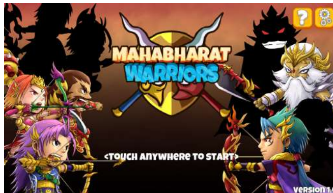
Gambar 2.3. Game “Mahabharat Warriors”