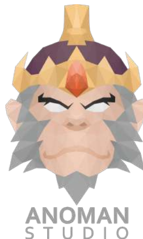
Gambar 2.1. Logo Anoman Studio