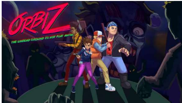
Gambar 2.2. Promotional Art “Orbiz”

Sampai saat ini, Anoman Studio tetap berfokus mengembangkan dan menerbitkan game mobile , desktop , dan animasi. Salah satu game tersebut dapat ditemui dari penghargaan yang diterima dari tahun 2014 sampai 2017. Pada tahun 2014 Anoman Studio meraih peringkat 1 dalam kompetisi Protowars UMN, mendapatkan Merit Award - INAICTA 2015, Top 100 Best Indie Game (2015), The most Innovative Game - Indonesia Indie Game 2015, meraih peringkat 3 di Samsung Gear VR Challenge pada tahun 2016, serta menjadi Game of The Year di Popcon Award pada tahun 2017 dengan game yang berjudul “Orbiz”. “Orbiz” adalah game kooperatif 4 pemain bertema survival melawan pasukan zombie . Game tersebut selanjutnya rilis di platform Steam sebagai game desktop atau komputer berbayar