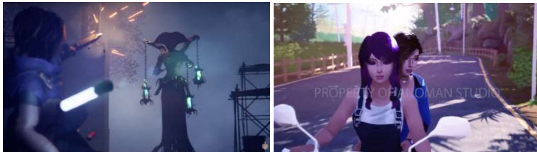
Gambar 2.6. Video “Project Darma - Official Trailer” dan “Darma Teaser”

Animasi lainnya berupa video berjudul “Project Darma - Official Trailer” dan teaser berjudul “Darma Teaser” untuk game yang sedang dalam proses pengembangan, yaitu “Project Darma”. Kedua video tersebut diunggah ke dalam channel Youtube Anoman Studio.