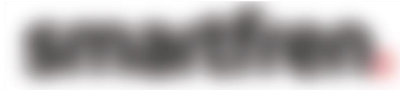
Gambar 2. 1 Logo PT.XYZ

PT.XYZ merupakan salah satu perusahaan penyedia layanan telekomunikasi terdepan di Indonesia untuk segmen ritel dan korporat. Perusahaan telekomunikasi berbasis teknologi CDMA ini mulai beroperasi di Indonesia pada tahun 2011. Sebelumnya perusahaan ini bernama XXX-8 Telecom, lalu diakuisisi oleh PT.XXX sehingga nama perusahaan berganti menjadi PT.XYZ. Tidak hanya mengembangkan layanan telepon dan data, perusahaan ini juga aktif memproduksi perangkat telepon CDMA di Indonesia dengan merek Andromax. Dengan perkembangan zaman yang pesat PT.XYZ juga mengembangkan pemasaran dan penjualan produknya secara online di platform website perusahaannya sendiri.